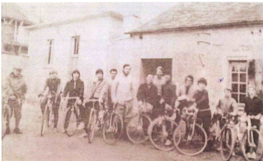
Lieu de regroupement dans le square Lac Mégantic actuel